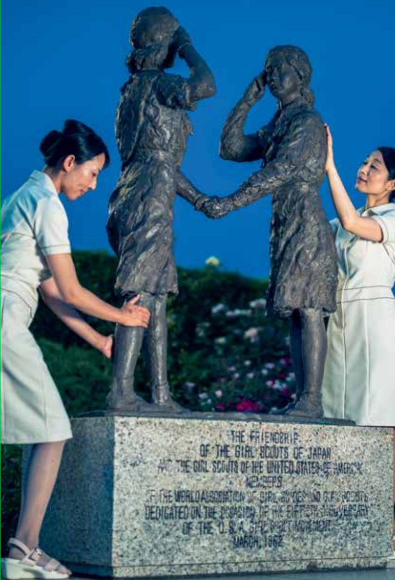
Christian Jankowski Massage Masters Detail, 2017