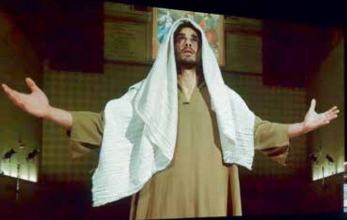
Christian Jankowski, Casting Jesus , 2011 Installationsansicht, Lisson Gallery, London

Unter dem Titel I WAS TOLD TO GO WITH THE FLOW stellt die große Werkschau in der Kunsthalle Tübingen das umfangreiche Œuvre Jankowskis – das neben Filmen auch Fotografie, Skulptur und Malerei umfasst – im Überblick vor. Die Metapher des reisenden Künstlers führt dabei mitten ins Herz