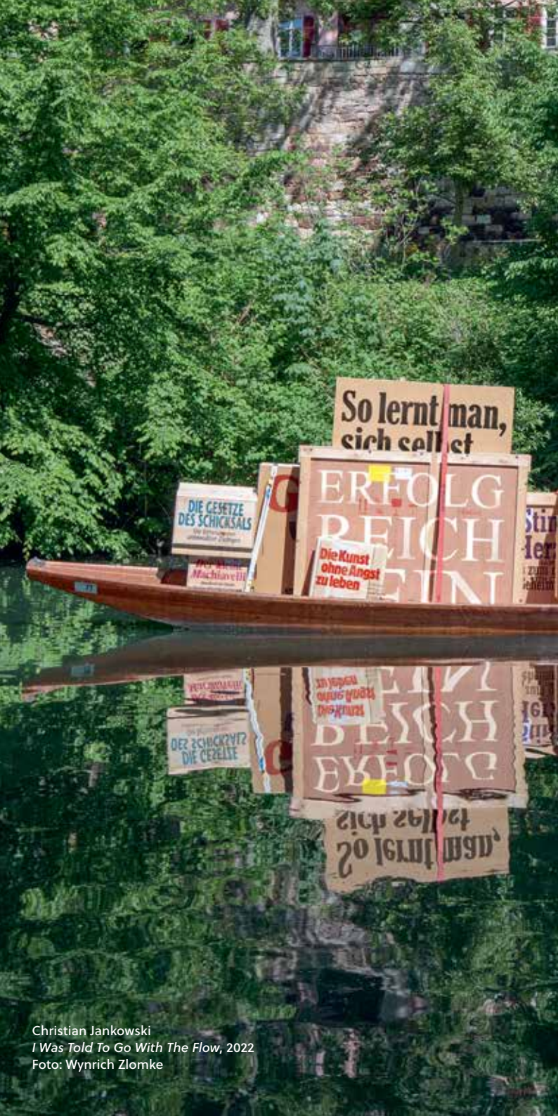
Christian Jankowski I Was Told To Go With The Flow , 2022