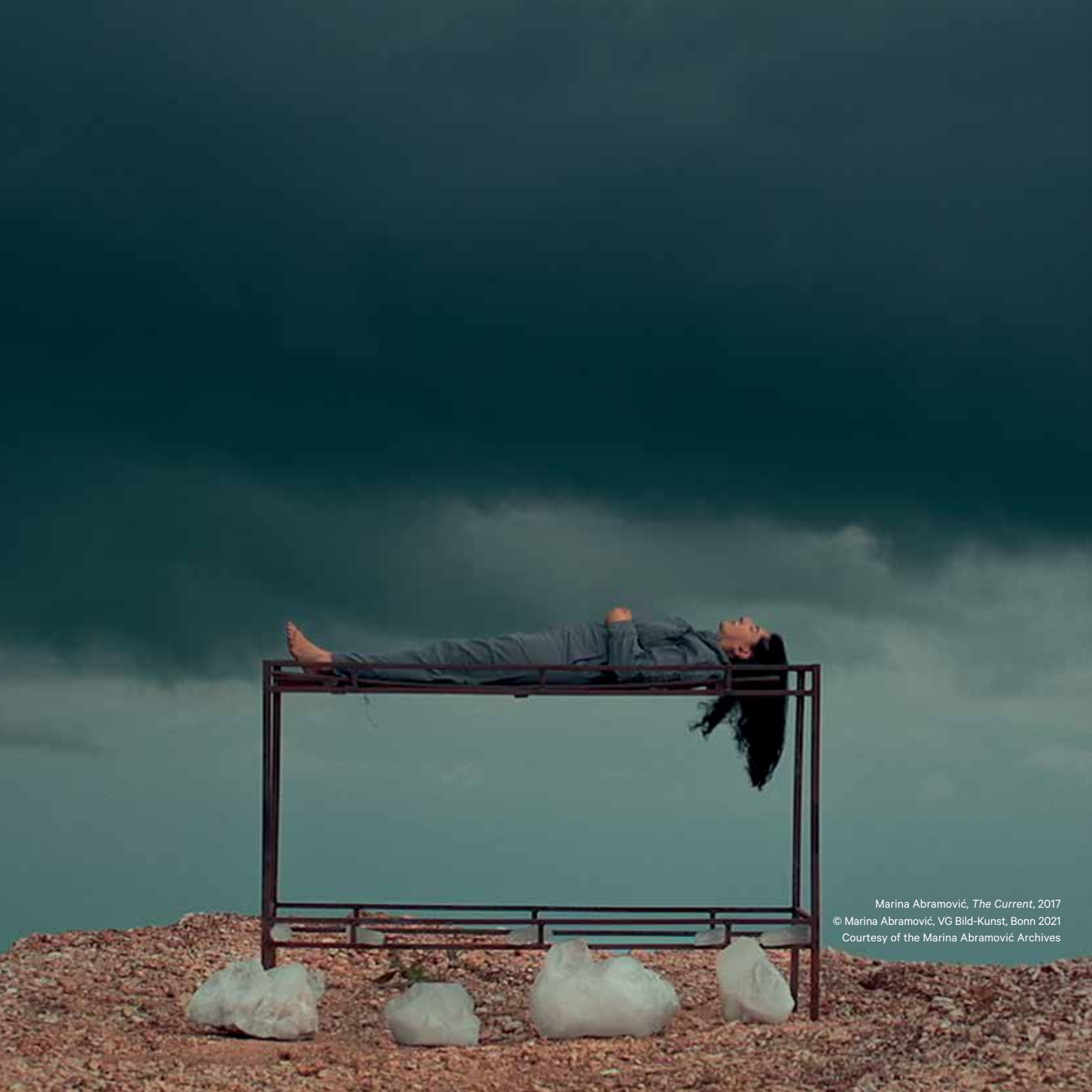
Marina Abramović, The Current , 2017