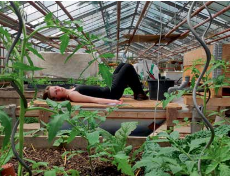
Künstlergruppe GOLDSTAUB bei den Dreharbeiten zum Film Tränen der Daphne

FREITAG, 27. AUGUST, 15:30–19:30 UHR SELBSTBILDNISSE ERSCHAFFEN 18/19 Workshop mit dem Künstler Martin Alber