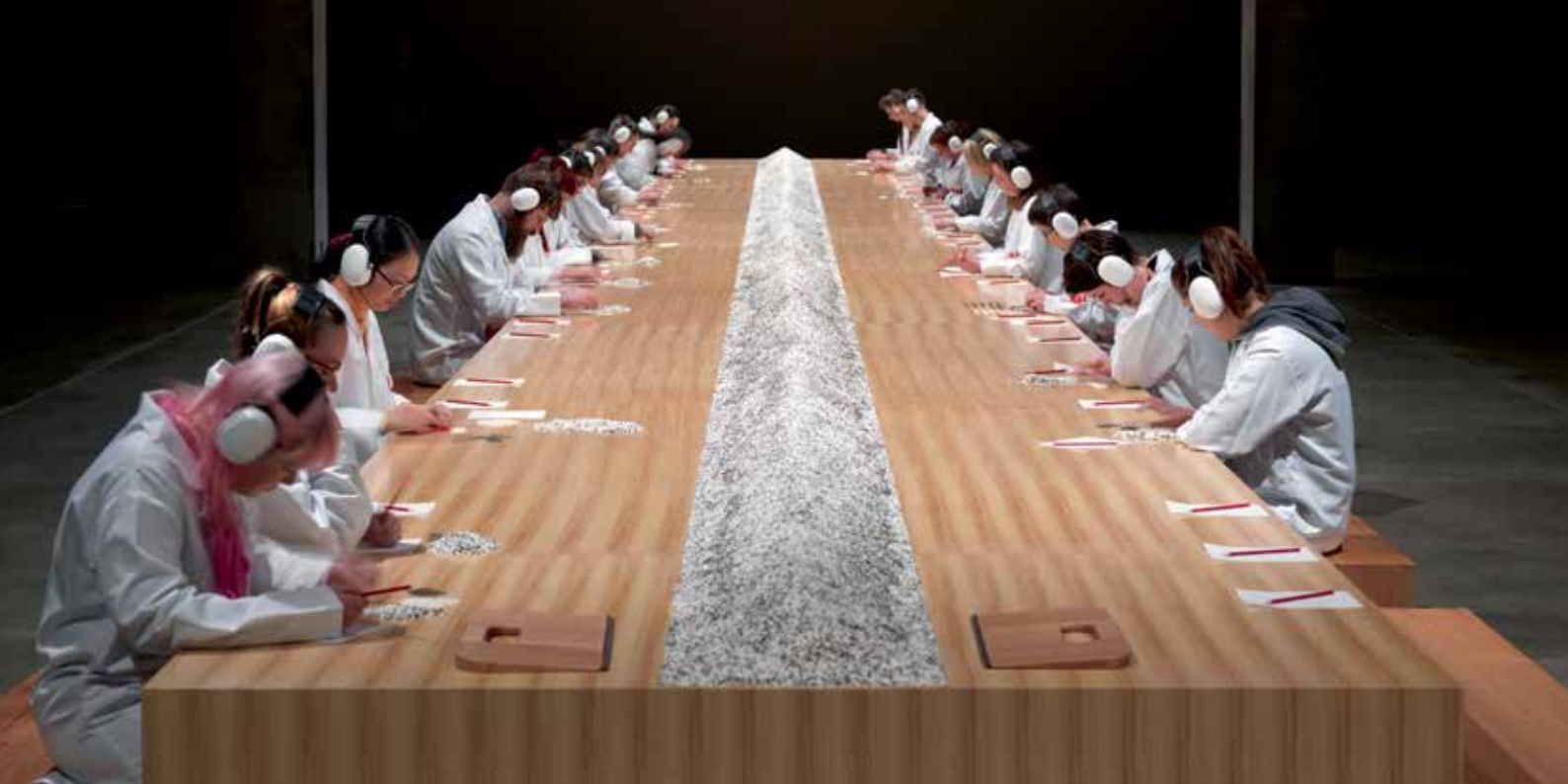
Marina Abramović, Counting the Rice , 2015 Übung mit Beteiligung des Publikums aus einer Workshop-Reihe mit dem Titel Cleaning the House