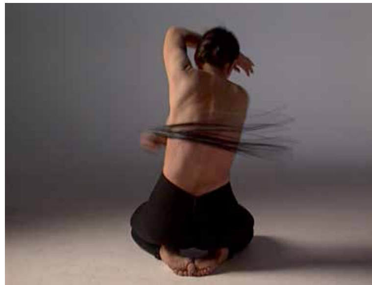
Marina Abramović, Spirit House – Dissolution , 1997

DONNERSTAG, 10. FEBRUAR, 18 UHR OCCUPY ART – KURZFÜHRUNG & APÉRO 12