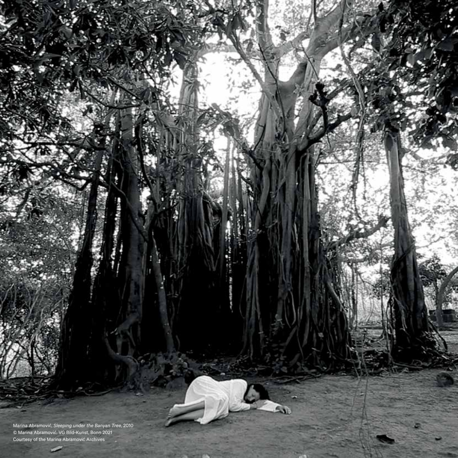
Marina Abramović, Sleeping under the Banyan Tree , 2010 © Marina Abramović, VG Bild-Kunst, Bonn 2021 Courtesy of the Marina Abramović Archives