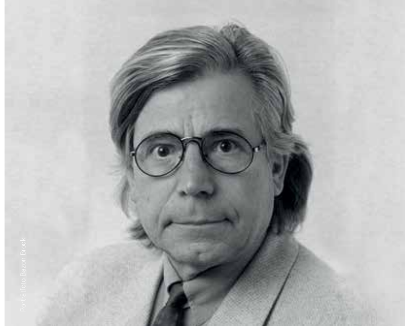
Portraitfoto Bazon Brock

Bei unseren Führungen und Angeboten achten wir auf die Einhaltung des Sicherheitsabstandes zwischen den Teilnehmenden. Deswegen behalten wir uns vor, die Teilnehmendenzahl ggf. zu begrenzen.