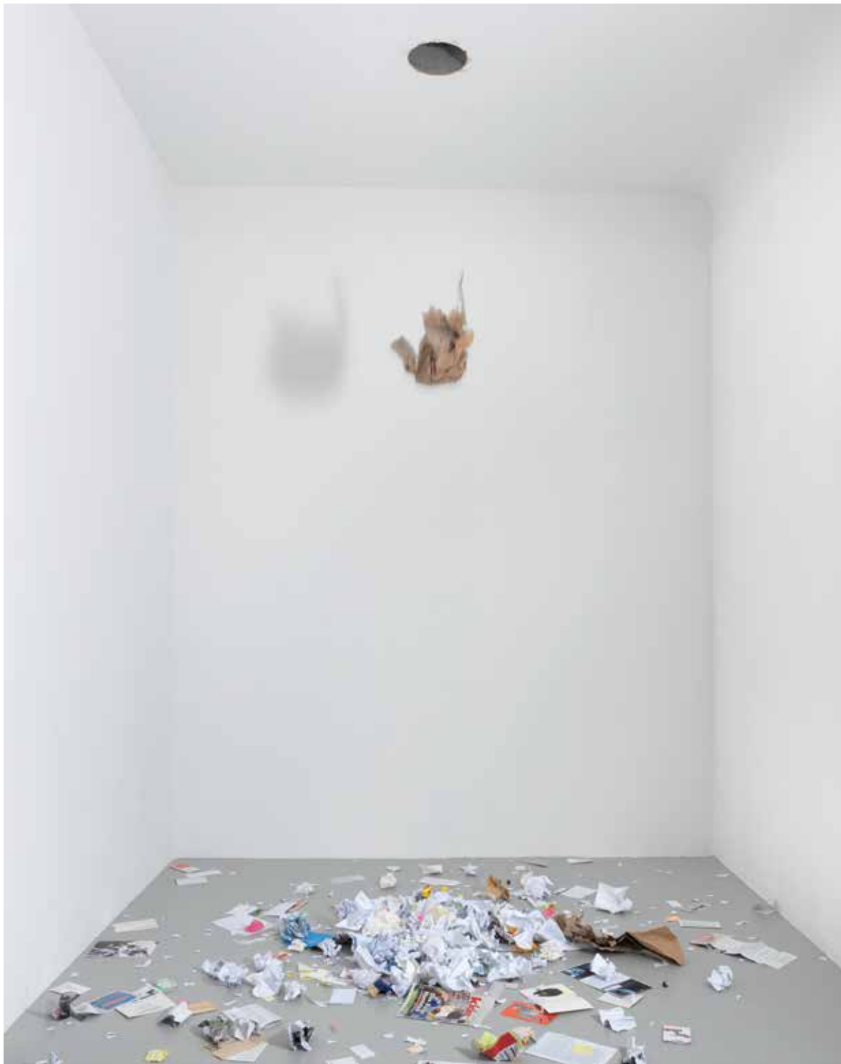
Karin Sander Kernbohrungen , 2011 Papierabfälle, 5 Löcher im Boden der Büros bzw. der Decke des Ausstellungsraumes, je \varnothing 30 cm Neuer Berliner Kunstverein, Berlin, 2011