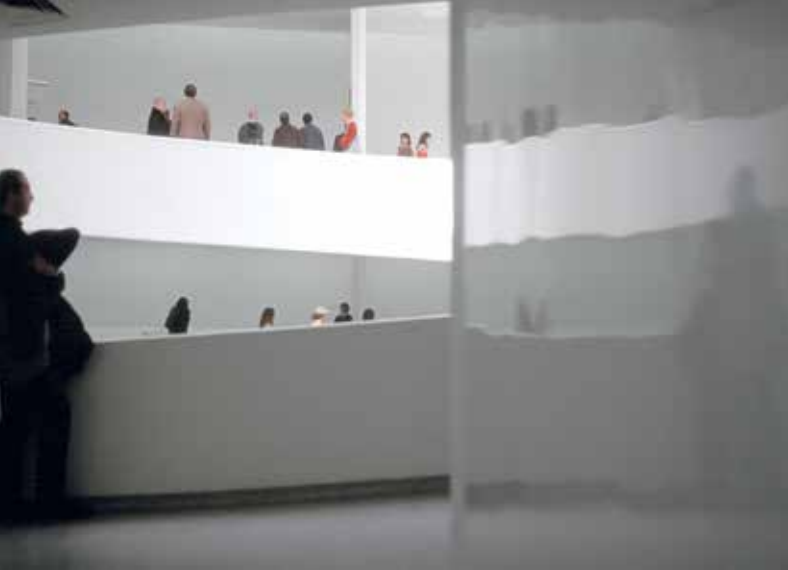
Karin Sander Wandstück 210 × 280, 2004 Wandfarbe, poliert, 210 × 280 cm Solomon R. Guggenheim Museum, New York, 2004