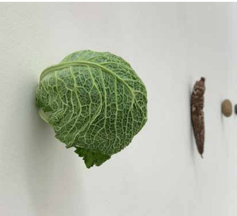
Karin Sander Wirsing , 2012, ( Kitchen Pieces ) Wirsing, Edelstahlnagel, 18 × 22 × 22 cm Kunst Museum Winterthur, 2018

KARIN SANDER 27. MÄRZ–04. JULI 2021 VERNISSAGE 26. MÄRZ