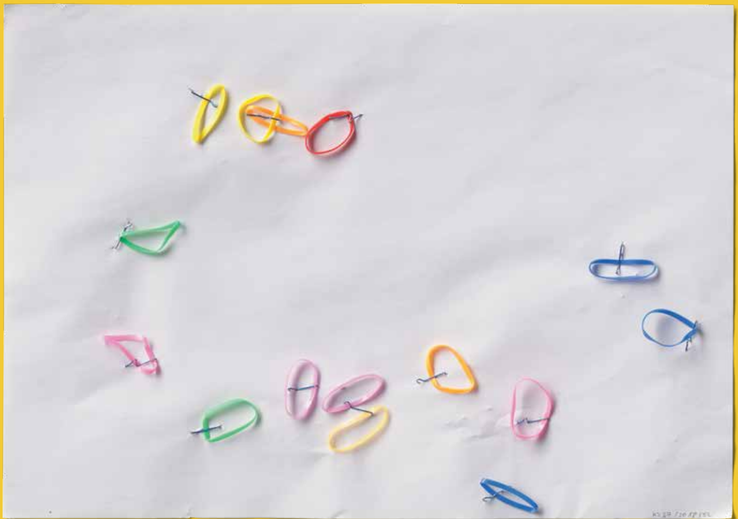
Karin Sander KS 2018 37 SL, 2018, (Office Works) Gummibänder, Heftklammern, Papier 21 x 29,7 cm