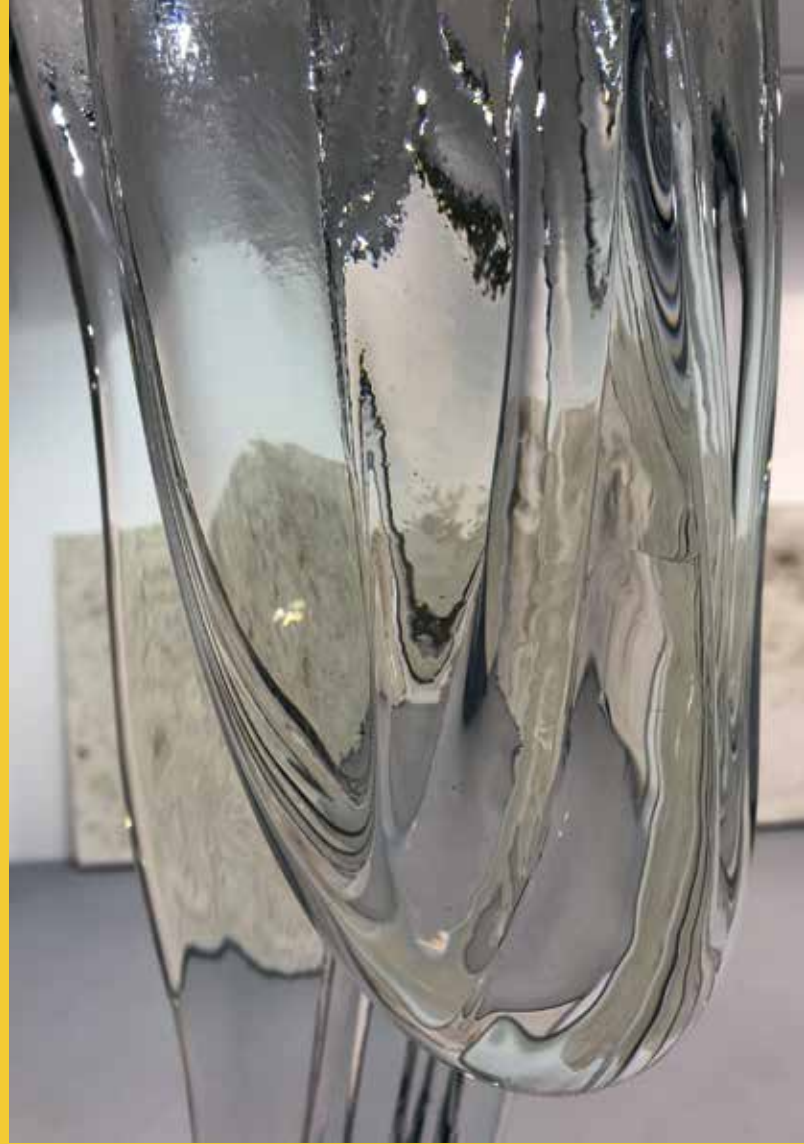
Karin Sander Glass Drop 13 , 2019 (Detail) Glas, 67 × 21 × 18 cm