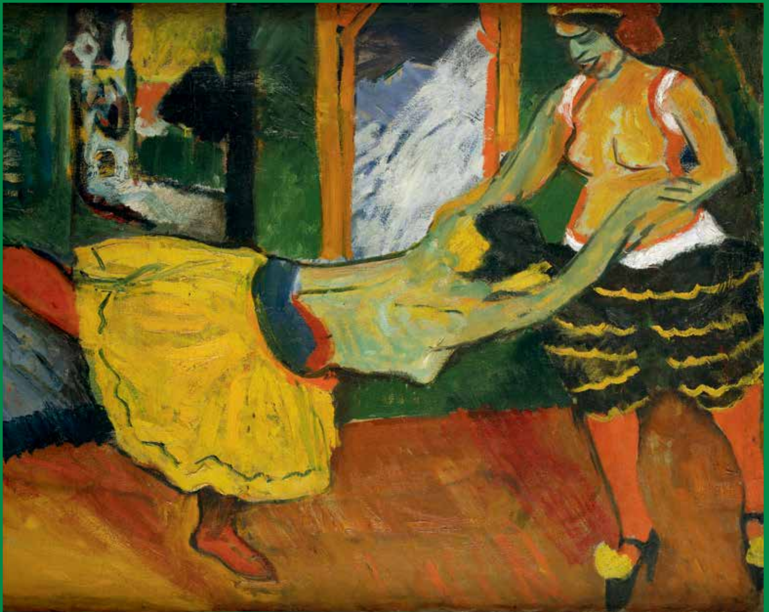
MAX PECHSTEIN TANZ, 1909 BRÜCKE-MUSEUM BERLIN DAUERLEIHGABE AUS PRIVATBESITZ

VORHERIGE SEITE MAX PECHSTEIN VARIÉTÉTÄNZER, DETAIL, 1928 PRIVATBESITZ