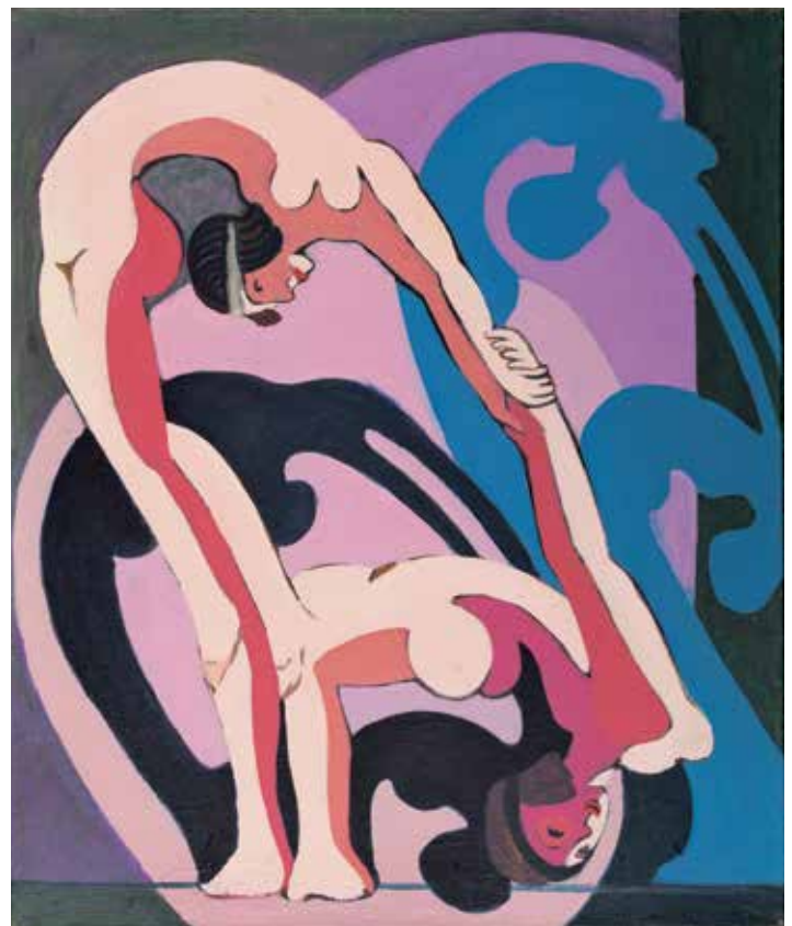
ERNST LUDWIG KIRCHNER AKROBATENPAAR – PLASTIK, 1932–33 KIRCHNER MUSEUM DAVOS, SCHENKUNG NACHLASS ERNST LUDWIG KIRCHNER 1990

Öffentliche Führungen: donnerstags 17 Uhr samstags/sonntags 15 Uhr sonntags 11:30 Uhr