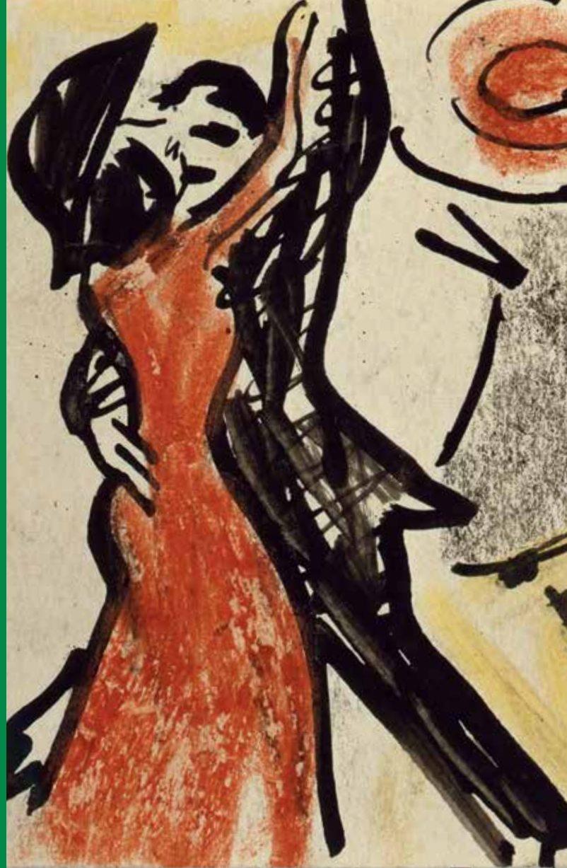
MAX PECHSTEIN TANZENDE PAARE, DETAIL, POSTKARTE AN ERICH HECKEL, BERLIN, STIFTUNG HISTORISCHE MUSEEN, ALTONAER MUSEUM, HAMBURG

VORHERIGE SEITE MAX PECHSTEIN TÄNZERIN IN EINER BAR, 1923/31 PRIVATBESITZ