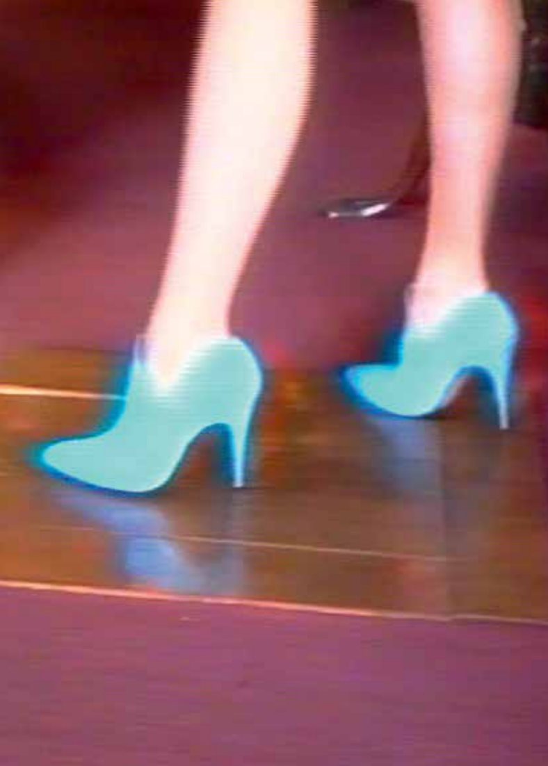
Sylvie Fleury Walking on Carl Andre (Detail), 1997 Video, 40 min