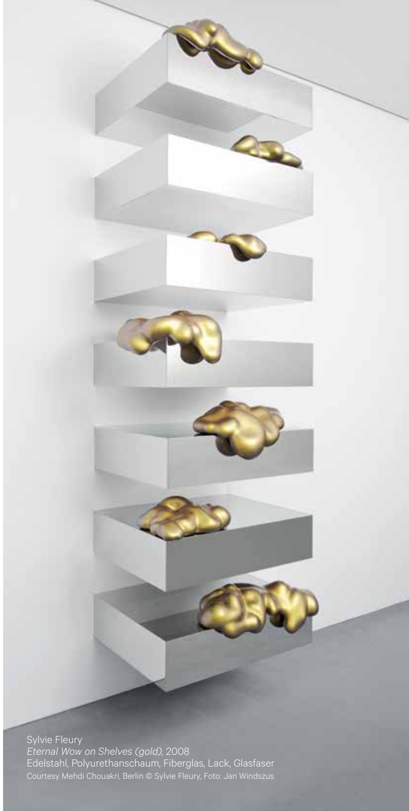
Sylvie Fleury Eternal Wow on Shelves (gold) , 2008 Edelstahl, Polyurethanschaum, Fiberglas, Lack, Glasfaser Courtesy Mehdi Chouakri, Berlin © Sylvie Fleury, Foto: Jan Windszus

CAFE KUNSTHALLE Philosophenweg 76 72076 Tübingen +49 (0) 7071 88 53 444 info@cafe-kunsthalle-tuebingen.de cafe-kunsthalle-tuebingen.de