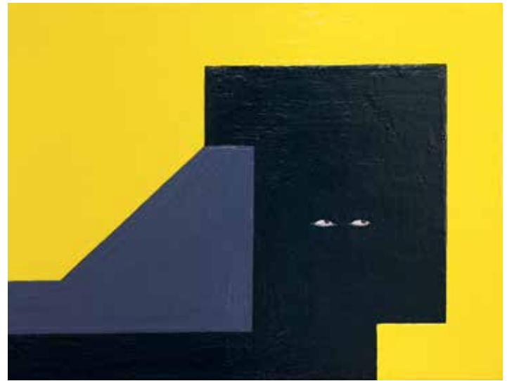
Ruth Root Untitled , 2002–2004 Emaillie auf Leinwand Privatsammlung Ravensburg © Ruth Root Foto: Wynrich Zlomke