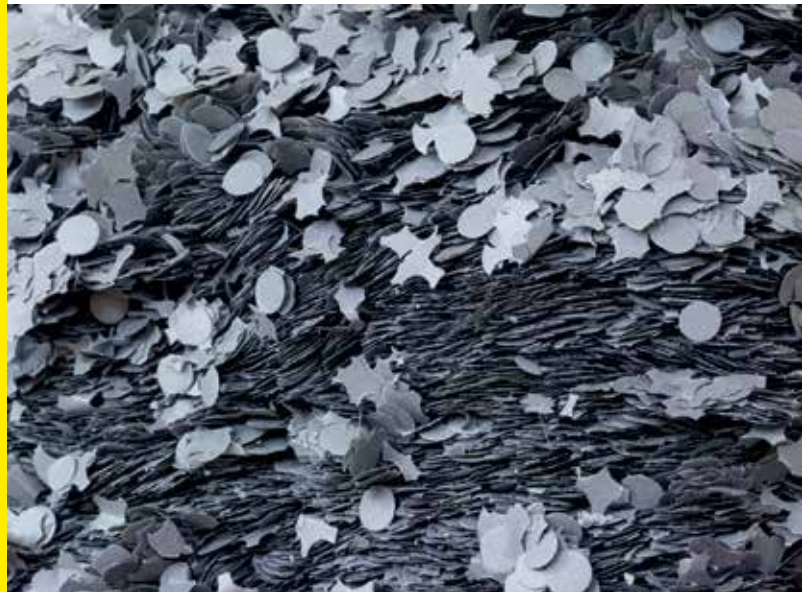
Lara Favaretto Village of the Damned (Detail) , 2014 Konfetti Courtesy Rennie Collection, Vancouver © Lara Favaretto Foto: Blaine Campbell